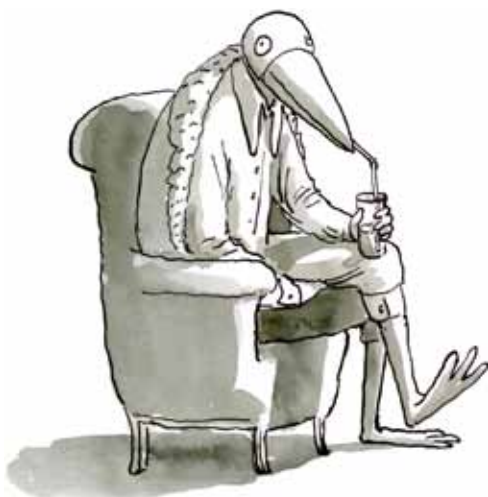
Le Professeur Zoulouck, un personnage de fiction pour mieux faire passer les témoignages

En 1998, il rencontrait David, un jeune Chilien adopté, en difficulté, à qui il proposa d'écrire une chanson sur son histoire. L'impact de cette